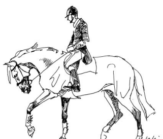
obniżone, głębokie i zaokrąglone