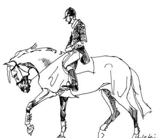
obniżone, głębokie i zaokrąglone