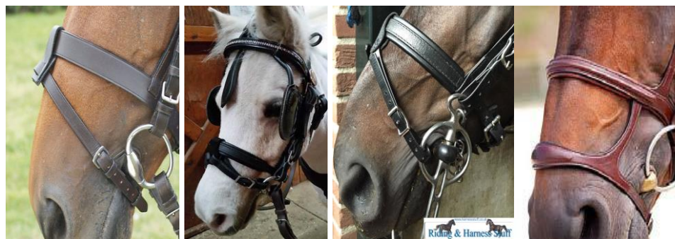
(nachrapnik ze skośnikiem lub z dolnym paskiem)

We wszystkich kategoriach niedozwolone są : kineton, „bit lifters”, (nachrapnik z dolnym paskiem lub skośnikiem).